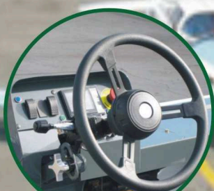
Poste de conduite