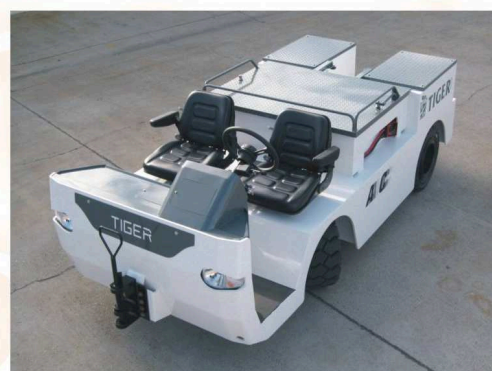
Ergonomique et maniable