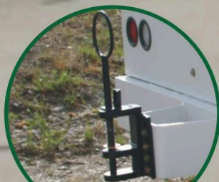
Détail attelage en E