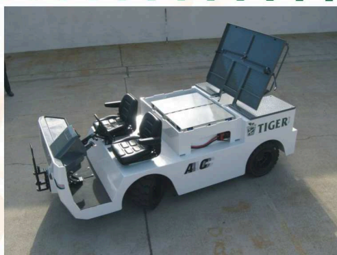
Robuste et confortable