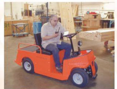
Existe en version 4 roues