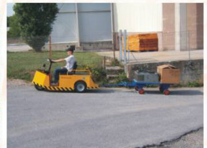
Economique et maniable